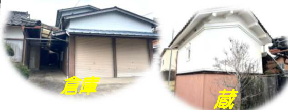
倉庫1F ※概略図につき現況優先とさせていただきます。

不動産売買・賃貸・管理のご相談は 〒669-4323 兵庫県丹波市市島町梶原123番地2 有限会社 塩谷不動産商事